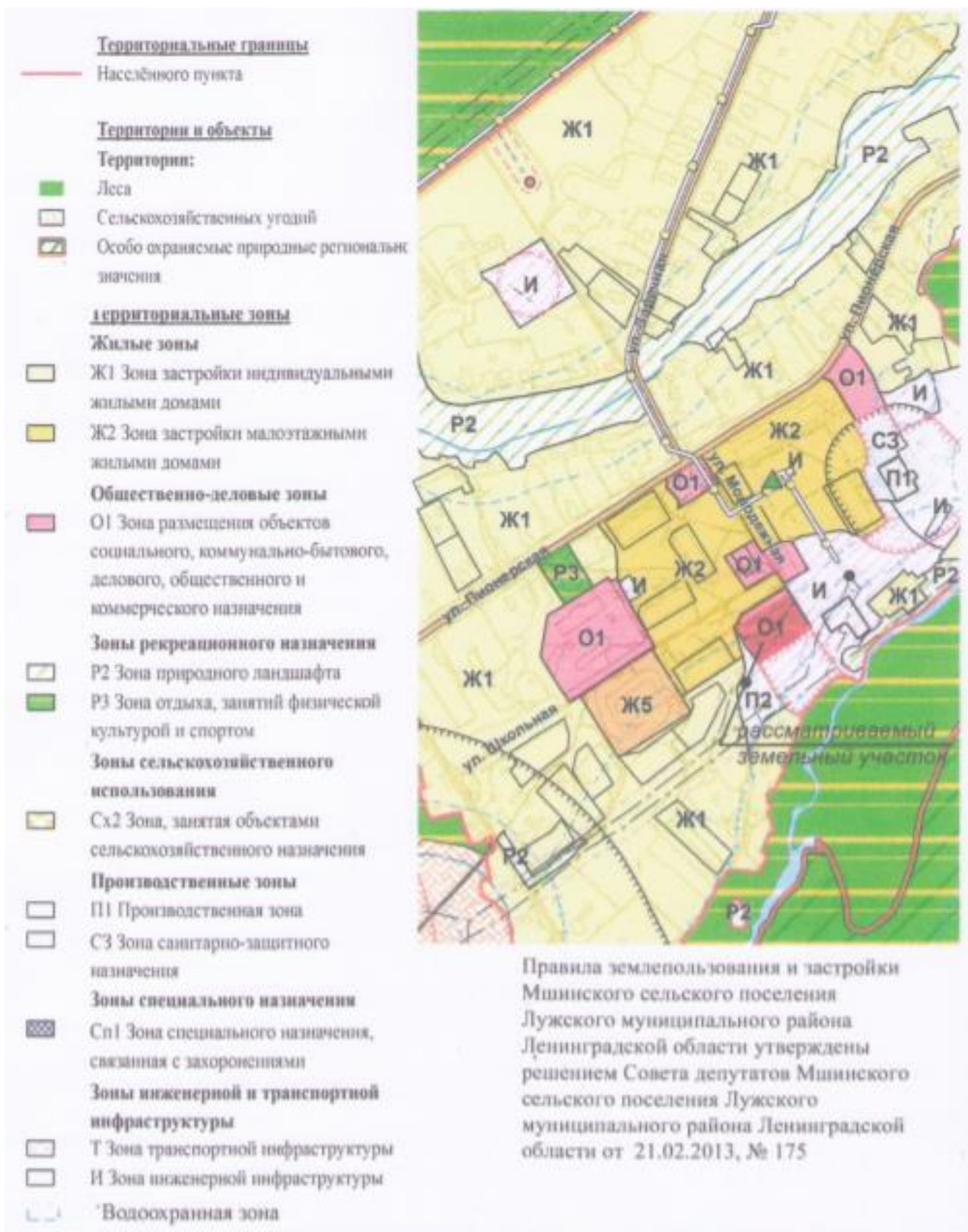
Схема расположения земельного участка по адресу: Ленинградская область, Лужский муниципальный район, Мшинское сельское поселение, д.Пехенец, ул.Молодежная, д.1а

Правила землепользования и застройки Мшинского сельского поселения Лужского муниципального района Ленинградской области утверждены решением Совета депутатов Мшинского сельского поселения Лужского муниципального района Ленинградской области от 21.02.2013, № 175